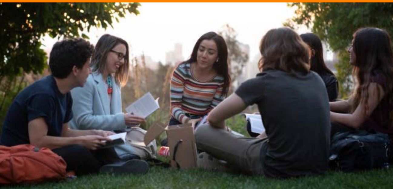
Clase Core Curriculum UAI.