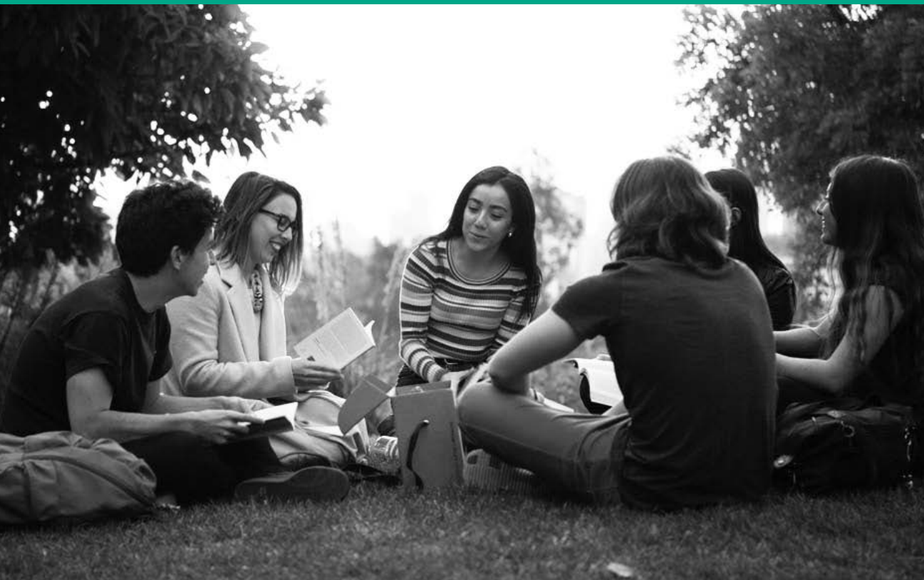
Clase Core Curriculum UAI.