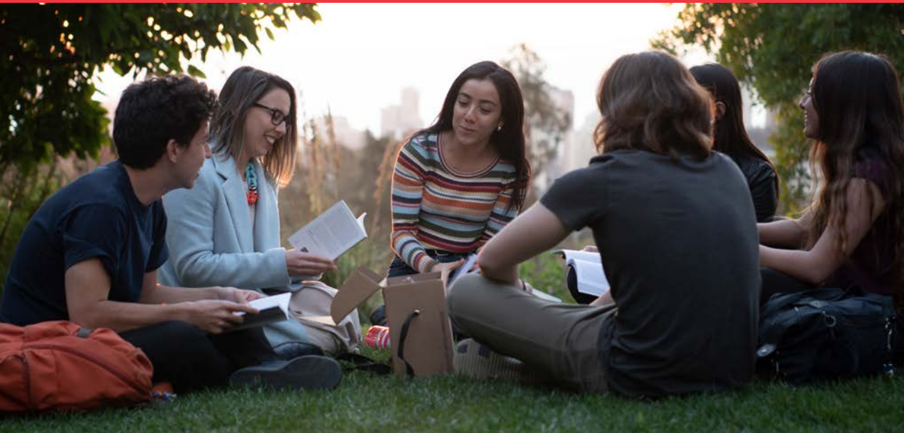
Clase Core Curriculum UAI.