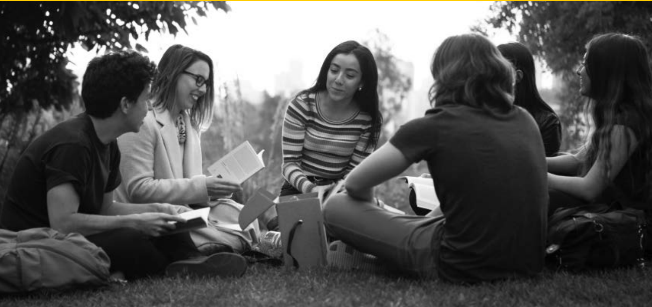
Clase Core Curriculum UAI.