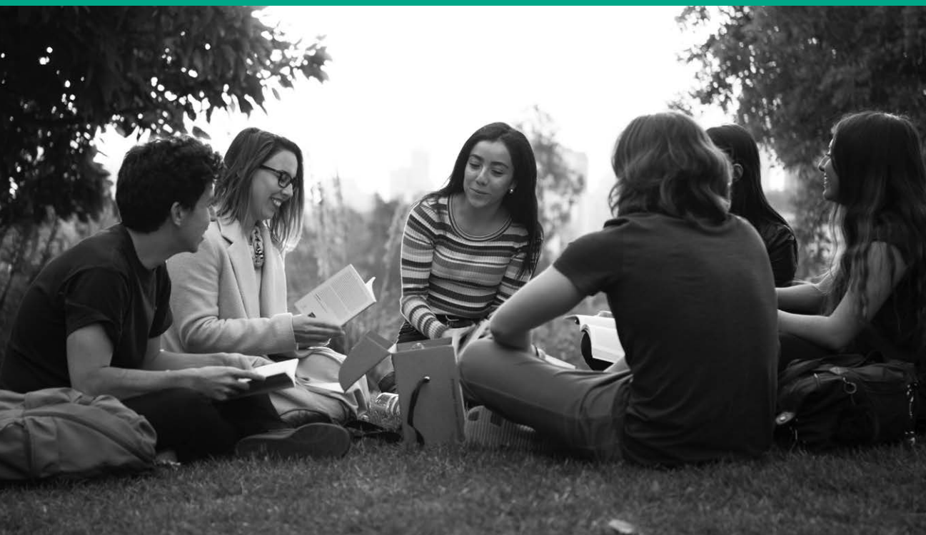
Clase Core Curriculum UAI.

LA UNIVERSIDAD ADOLFO IBÁÑEZ ASPIRA A QUE SUS ESTUDIANTES DESARROLLEN UNA PERSONALIDAD QUE REFUERCE LA LIBERTAD INDIVIDUAL Y SU EJERCICIO SOBRE LA BASE DE LA RESPONSABILIDAD PERSONAL. SE BUSCA QUE LOGREN UNA CONCEPCIÓN AMPLIA Y CRÍTICA DEL MUNDO QUE POSIBILITE QUE SEAN PERSONAS AUTÓNOMAS Y REFLEXIVAS, CAPACES DE ABORDAR LAS REALIDADES CAMBIANTES Y MULTIDIMENSIONALES QUE PLANTEAN LOS AVANCES TECNOLÓGICOS Y LA GLOBALIZACIÓN. SE PRETENDE, ADEMÁS, QUE ADQUIERAN UNA VISIÓN MULTIDISCIPLINARIA QUE LES PROVEA DE COMPETENCIAS TRANSVERSALES Y LES PERMITA INTEGRARSE A EQUIPOS DE TRABAJO DIVERSOS. SE QUIERE DOTARLOS DE UNA CAPACIDAD DE ANTICIPACIÓN Y BÚSQUEDA DE LO EXCEPCIONAL, TRATANDO DE QUE ESTÉN INSPIRADOS POR UN AFÁN DE DESCUBRIMIENTO Y UN ESPÍRITU DE AVENTURA, TRABAJANDO SIEMPRE CON INTENSIDAD Y CONSTANCIA. POR ÚLTIMO, QUE MANIFIESTEN UN COMPROMISO CON EL BIENESTAR DE LOS DEMÁS Y NO SÓLO EN EL PROPIO.