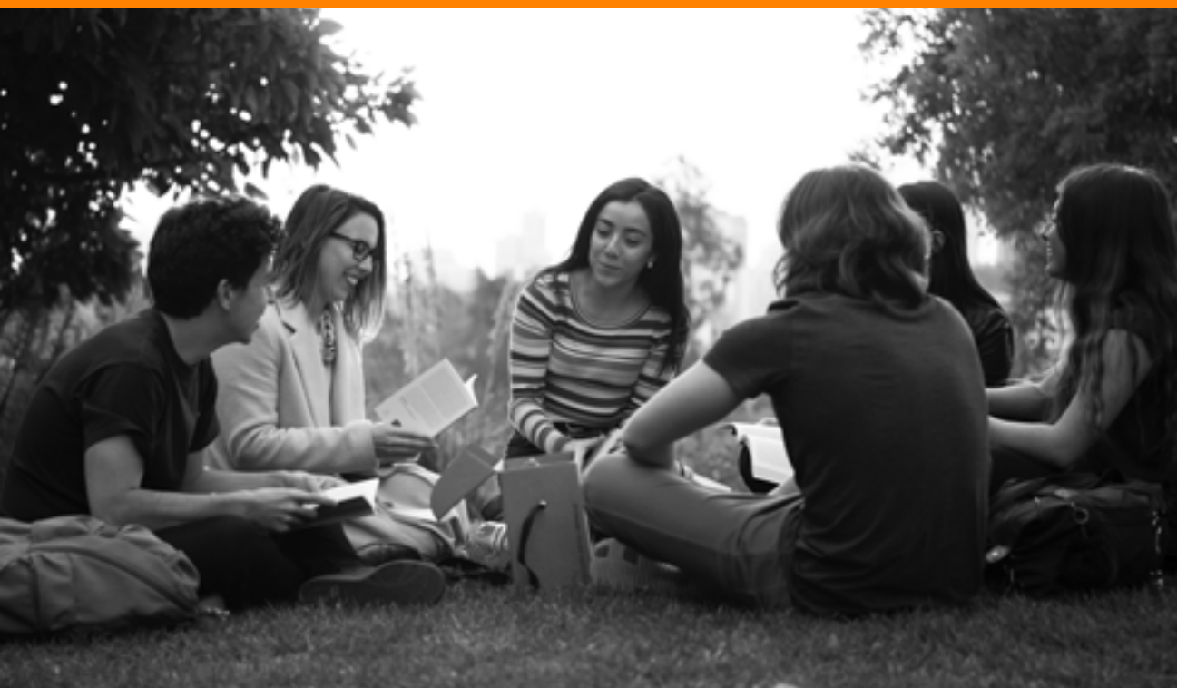
Clase Core Curriculum UAI.

LA UNIVERSIDAD ADOLFO IBÁÑEZ ASPIRA A QUE SUS ESTUDIANTES DESARROLLEN UNA PERSONALIDAD QUE REFUERCE LA LIBERTAD INDIVIDUAL Y SU EJERCICIO SOBRE LA BASE DE LA RESPONSABILIDAD PERSONAL. SE BUSCA QUE LOGREN UNA CONCEPCIÓN AMPLIA Y CRÍTICA DEL MUNDO QUE POSIBILITE QUE SEAN PERSONAS AUTÓNOMAS Y REFLEXIVAS, CAPACES DE ABORDAR LAS REALIDADES CAMBIANTES Y MULTIDIMENSIONALES QUE PLANTEAN LOS AVANCES TECNOLÓGICOS Y LA GLOBALIZACIÓN. SE PRETENDE, ADEMÁS, QUE ADQUIERAN UNA VISIÓN MULTIDISCIPLINARIA QUE LES PROVEA DE COMPETENCIAS TRANSVERSALES Y LES PERMITA INTEGRARSE A EQUIPOS DE TRABAJO DIVERSOS. SE QUIERE DOTARLOS DE UNA CAPACIDAD DE ANTICIPACIÓN Y BÚSQUEDA DE LO EXCEPCIONAL, TRATANDO DE QUE ESTÉN INSPIRADOS POR UN AFÁN DE DESCUBRIMIENTO Y UN ESPÍRITU DE AVENTURA, TRABAJANDO SIEMPRE CON INTENSIDAD Y CONSTANCIA. POR ÚLTIMO, QUE MANIFIESTEN UN COMPROMISO CON EL BIENESTAR DE LOS DEMÁS Y NO SÓLO EN EL PROPIO.