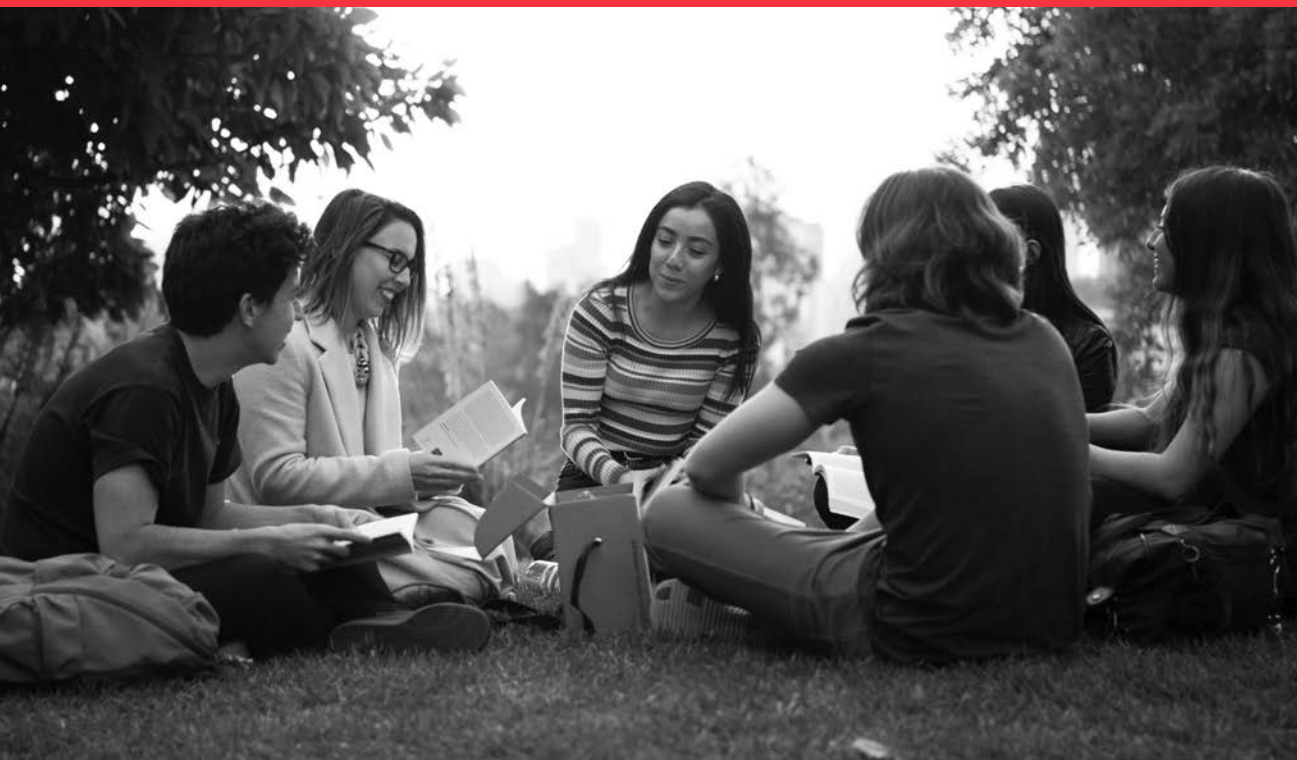
Clase Core Curriculum UAI.

LA UNIVERSIDAD ADOLFO IBÁÑEZ ASPIRA A QUE SUS ESTUDIANTES DESARROLLEN UNA PERSONALIDAD QUE REFUERCE LA LIBERTAD INDIVIDUAL Y SU EJERCICIO SOBRE LA BASE DE LA RESPONSABILIDAD PERSONAL. SE BUSCA QUE LOGREN UNA CONCEPCIÓN AMPLIA Y CRÍTICA DEL MUNDO QUE POSIBILITE QUE SEAN PERSONAS AUTÓNOMAS Y REFLEXIVAS, CAPACES DE ABORDAR LAS REALIDADES CAMBIANTES Y MULTIDIMENSIONALES QUE PLANTEAN LOS AVANCES TECNOLÓGICOS Y LA GLOBALIZACIÓN. SE PRETENDE, ADEMÁS, QUE ADQUIERAN UNA VISIÓN MULTIDISCIPLINARIA QUE LES PROVEA DE COMPETENCIAS TRANSVERSALES Y LES PERMITA INTEGRARSE A EQUIPOS DE TRABAJO DIVERSOS. SE QUIERE DOTARLOS DE UNA CAPACIDAD DE ANTICIPACIÓN Y BÚSQUEDA DE LO EXCEPCIONAL, TRATANDO DE QUE ESTÉN INSPIRADOS POR UN AFÁN DE DESCUBRIMIENTO Y UN ESPÍRITU DE AVENTURA, TRABAJANDO SIEMPRE CON INTENSIDAD Y CONSTANCIA. POR ÚLTIMO, QUE MANIFIESTEN UN COMPROMISO CON EL BIENESTAR DE LOS DEMÁS Y NO SÓLO EN EL PROPIO.