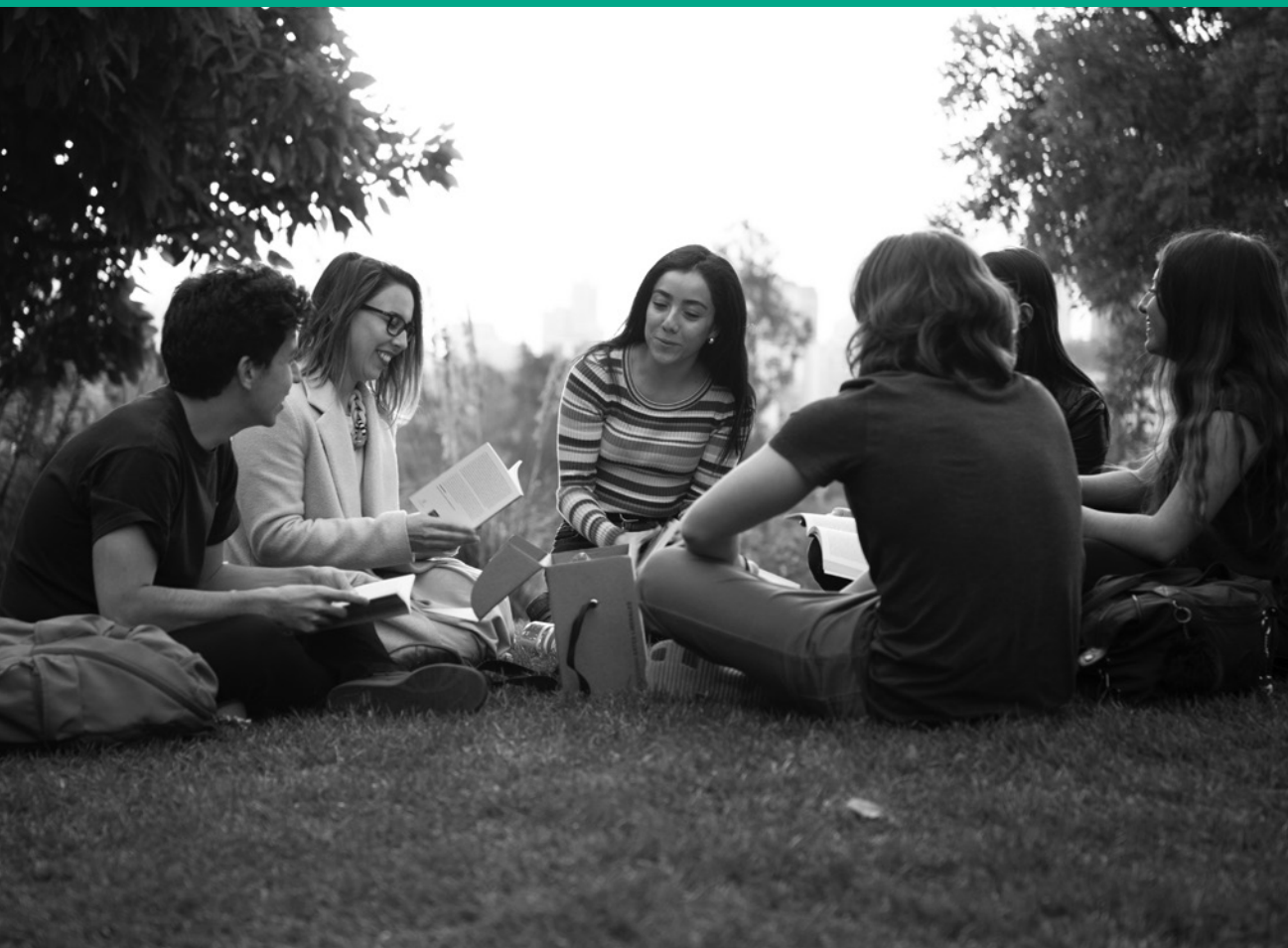
Clase Core Curriculum UAI.

LA UNIVERSIDAD ADOLFO IBÁÑEZ (UAI) ENTREGA UNA EDUCACIÓN BASADA EN LOS PRINCIPIOS DE LA LIBERTAD, DE AHÍ SU LEMA “PENSAR CON LIBERTAD”, Y EN LA RESPONSABILIDAD PERSONAL, QUE PERMITE A SUS ESTUDIANTES DESARROLLAR LA TOTALIDAD DE SU POTENCIAL INTELECTUAL Y HUMANO. PARA LOGRAR ESTO, LA UAI ASUME EL COMPROMISO DE IMPARTIR UNA FORMACIÓN PROFESIONAL CON ALTOS ESTÁNDARES ACADÉMICOS, CONTRIBUIR A EXPANDIR LAS FRONTERAS DEL CONOCIMIENTO A TRAVÉS DE INVESTIGACIÓN DE ALTO NIVEL Y TRANSFERIR ESTOS CONOCIMIENTOS PARA BENEFICIO DE LA SOCIEDAD.